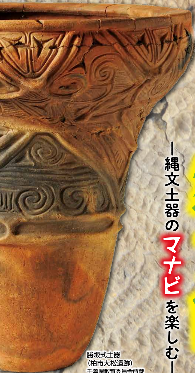
勝坂式土器 (柏市大松遺跡) 千葉県教育委員会所蔵