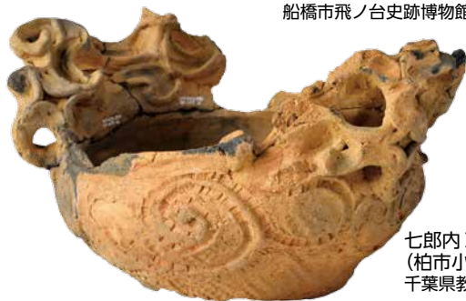
七郎内Ⅱ群土器 (柏市小山台遺跡) 千葉県教育委員会所蔵