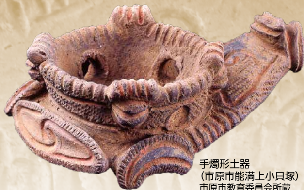
手燭形土器 (市原市能満上小貝塚) 市原市教育委員会所蔵