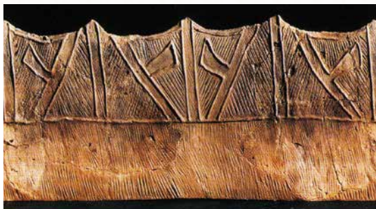
野島式土器(船橋市飛ノ台貝塚) 船橋市飛ノ台史跡博物館所蔵

研究者や芸術家をはじめ、多くの人々を魅了し続ける「縄文土器」。その研究テーマは、土器型式や地域性、文化、製作技法などの考古学に関わるものから、芸術的観点からみた造形美など、きわめて多岐にわたり、数多の「マナビ」を秘めています。令和3年度の出土遺物公開事業では、「えりすぐり」の縄文土器を県内外から集結させ、一挙大公開します。「らくがく縄文館」で縄文土器が秘めた「マナビ」に楽しみながら触れてみてください。