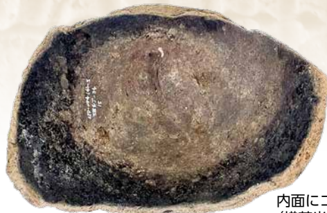
内面にコゲが付着した土器 (横芝光町高谷川低地遺跡) 千葉県教育振興財団保管