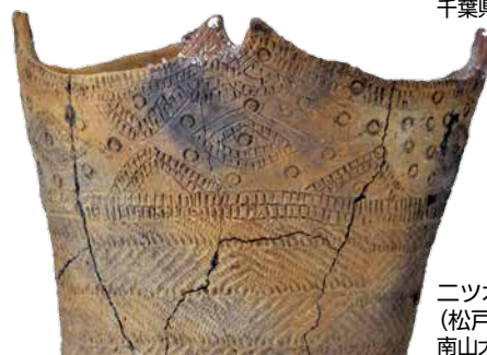
二ツ木式土器 (松戸市二ツ木向台貝塚) 南山大学人類学博物館所蔵